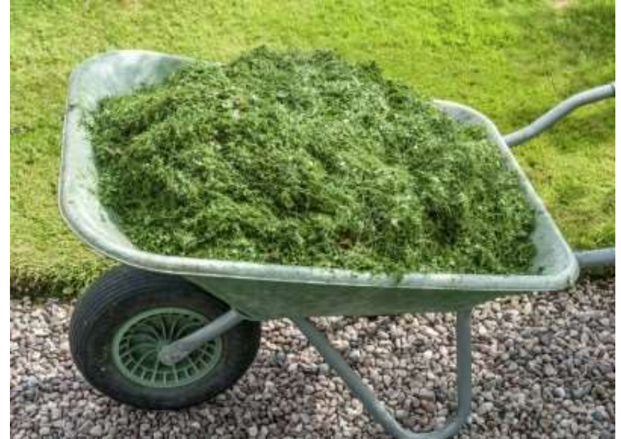
Трава як джерело цінних матеріалів