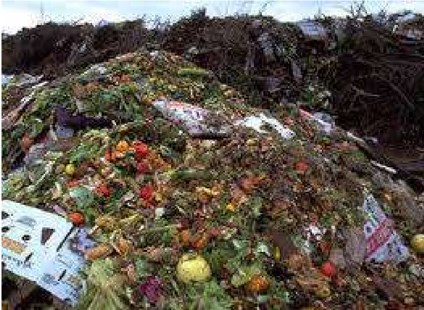
Органічні відходи з теплиць та ресторанів