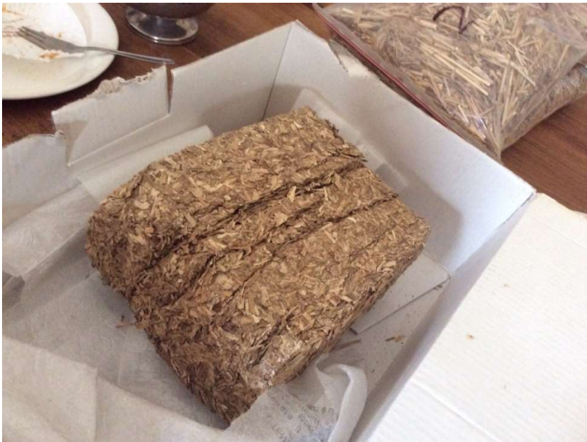
Брикет з очерету